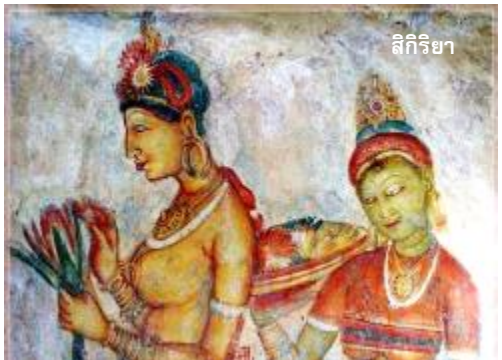
สิกิริยา