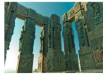
CHRONICLE OF GEORGIA

** พักที่ Clock Town Hotel หรือเทียบเท่า **