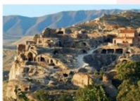
เมืองอพลิสซิค