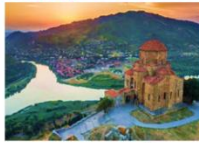
อารามจวารี