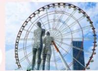
รูปปั้นอาลีและนีโน