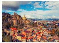
เมืองทบิลีซี

05.20 น. เดินทางถึงสนามบินอิสตันบูล แวะเปลี่ยนเครื่อง 06.55 น. ออกเดินทางสู่สนามบินทบิลีซี เที่ยวบิน TK378 09.45 น. เดินทางถึงสนามบินทบิลีซี ประเทศจอร์เจีย