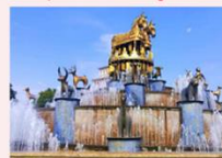
เมืองคูโทซี

** พักที่ Kutaisi Inn Hotel หรือเทียบเท่า **