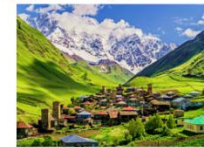
หมู่บ้าน Ushguli

** พักที่ Best Western Hotel หรือเทียบเท่า **