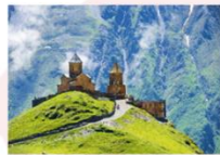
Gergeti sameba church

** พักที่ Intourist Kazbegi Hotel หรือเทียบเท่า **