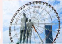
รูปปั้นอาลีและนีโน