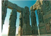
CHRONICLE OF GEORGIA

** พักที่ Clock Town Hotel หรือเทียบเท่า **