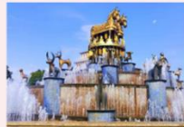
เมืองคูไทซี

** พักที่ Kutaisi Inn Hotel หรือเทียบเท่า **