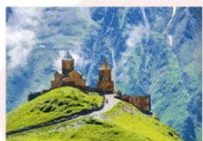
Gergeti sameba church

** พักที่ Intourist Kazbegi Hotel หรือเทียบเท่า **