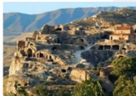
เมืองอพลิสซิค