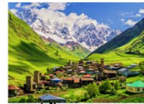
หมู่บ้าน Ushguli

** พักที่ Best Western Hotel หรือเทียบเท่า **