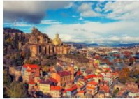
เมืองทบิลีซี

05.20 น. เดินทางถึงสนามบินอิสตันบูล แวะเปลี่ยนเครื่อง 06.55 น. ออกเดินทางสู่สนามบินทบิลีซี เที่ยวบิน TK378 09.45 น. เดินทางถึงสนามบินทบิลีซี ประเทศจอร์เจีย