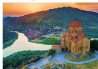
อารามจวารี