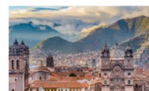
ย่านเมืองเก่าคุซโก้

** พักที่ San Agustin La Recoleta Hotel 4* หรือเทียบเท่า **