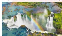
อุทยานแห่งชาติอิกวาซู

xx.xx น. ออกเดินทางสู่อุทยานแห่งชาติอิกวาซู เที่ยวบิน... xx.xx น. เดินทางถึงอุทยานแห่งชาติอิกวาซู