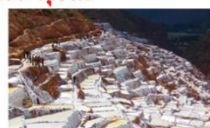
เหมืองเกลือโบราณ

** พักที่ San Agustin La Recoleta Hotel 4* หรือเทียบเท่า **