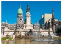
ชมเมืองบัวโนสไอเรส

23.55 น. ออกเดินทางสู่สนามบินอิสตันบูล เที่ยวบิน TK16