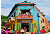
เมืองบัวโนสไอเรส

xx.xx น. ออกเดินทางสู่กรุงบัวโนสไอเรส เที่ยวบิน... xx.xx น. เดินทางถึงสนามบินบัวโนสไอเรส ประเทศอาร์เจนตินา