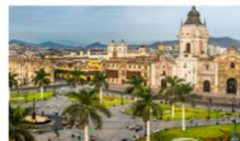
กรุงลิมา

xx.xx น. ออกเดินทางสู่กรุงลิมา เที่ยวบิน... xx.xx น. เดินทางถึงสนามบินลิมา ประเทศเปรู