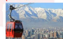
นั่งกระเช้าขึ้นสู่เนินเขาซานต้า ลูเซีย

xx.xx น. ออกเดินทางสู่เมืองปุนตาอาเรเนส เที่ยวบิน... xx.xx น. เดินทางถึงสนามบินปุนตาอาเรเนส ** พักที่ Novotel Las Condes Hotel 4* หรือเทียบเท่า **