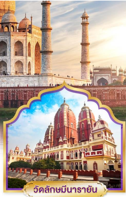
วัดลักษมีนารายณ์