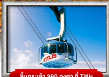
ขึ้นกระเช้า 360 องศา ที่ Titlis