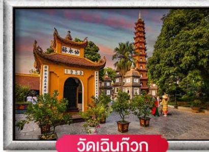
วัดเินก๊วก