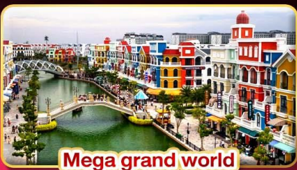
Mega grand world

📅 เดินทาง : 12-15 เม.ย. และ 13-16 เม.ย. 68