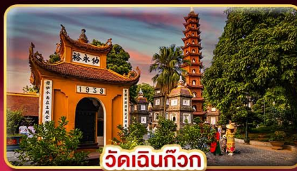
วัดเงินทิว