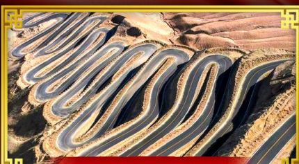
ถนนโบราณพันหลง