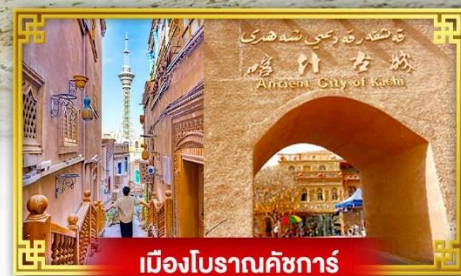
เมืองโบราณคัชการ์

เดินทางโดย : สายการบินโซนาเซาเทิร์นแอร์ไลน์