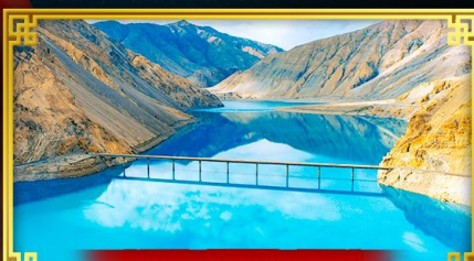
ทะเลสาบบินตีร์ (บลูลากูน)