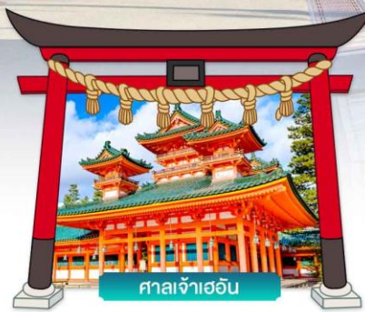
ศาลเจ้าเฮอัน