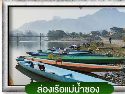
ล่องเรือแม่น้ำซอง