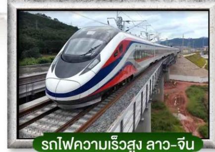
รถไฟความเร็วสูง ลาว-จีน