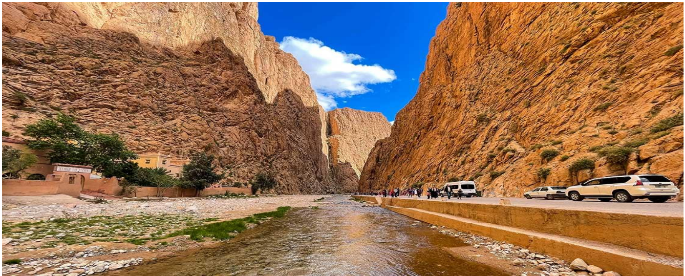
รูปร่างต่างๆ สวยงาม

นำท่านเดินทางสู่เมืองเมอร์ซูก้า (Merzouga) เดินทางข้ามเขา มิเดิล แอตลาส (Middle Atlas) ผ่านเส้นทางความสูง 3,090 เมตร ปกคลุมด้วยหิมะ และต้นสนขนาดใหญ่ ผ่านหุบเขาดาเดดส์ (Dades) หุบเขานี้ได้กลายเป็นสถานที่ท่องเที่ยวที่รู้จักกันในชื่อ ทอดร่าจอร์จ (Todra Gorge) แนวเทือกเขาทางธรรมชาติที่สวยงาม มีหลายรูปร่างแปลกตาซึ่งเป็นแนวเขาและธรรมชาติของหุบเขาที่ถูกกัดกร่อนจากแรงลม ทำให้หุบเขากลายเป็น