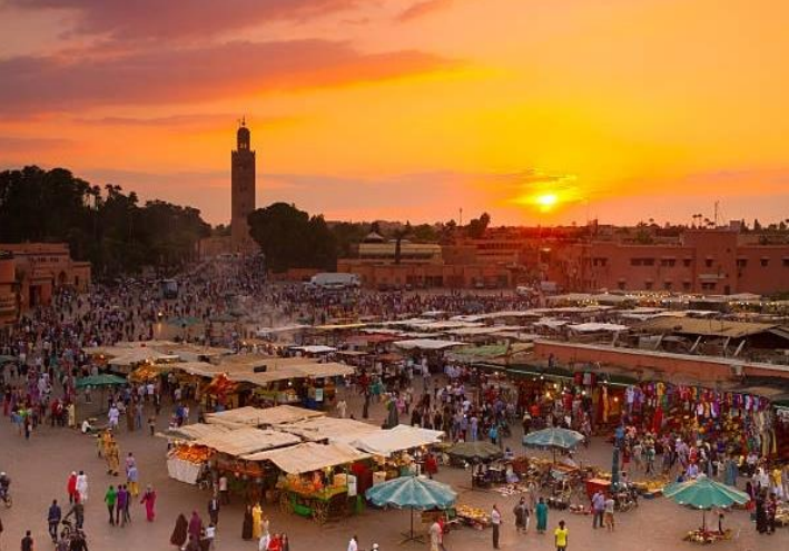
เมืองโมร็อกโคที่ไม่น่าเป็นชีวิตจริงได้อีกมากมาย

บ่าย ให้ท่านอิสระช้อปปิ้งที่ตลาด The Souks ตลาดใหญ่กลางเมืองมาราเกชสินค้าก็มีอย่างหลากหลายตั้งแต่ งานฝีมือ สไตล์โมร็อกโคแท้ เครื่องเทศ เครื่องหอม เสื้อผ้า เครื่องประดับ รองเท้า กระเป๋าและอื่นๆ ให้ท่านได้เลือกซื้อ