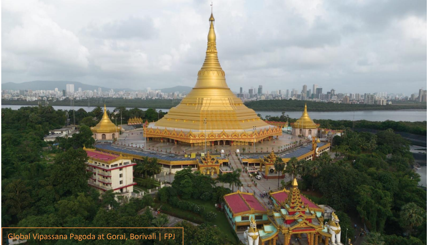
Global Vipassana Pagoda at Gorai, Borivali