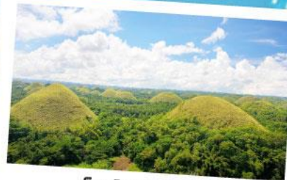
ช็อคโกแลตฮิลล์