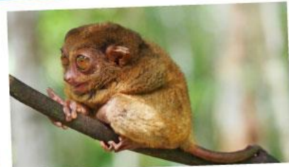
ลิงคาร์เธียร์