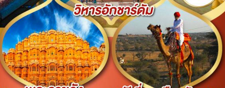
วิหารอักษรัดม