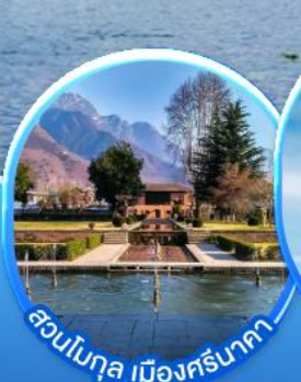
สวนโมกุล เมืองศรีนาคา