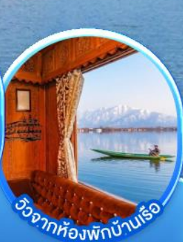
วิวจากห้องพักบ้านเรือ