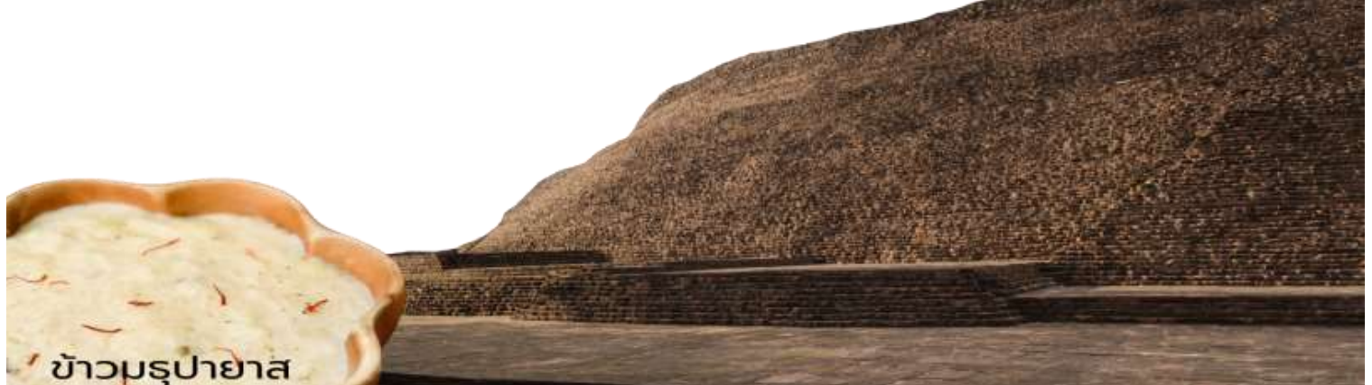
ข้าวมธุปายาส