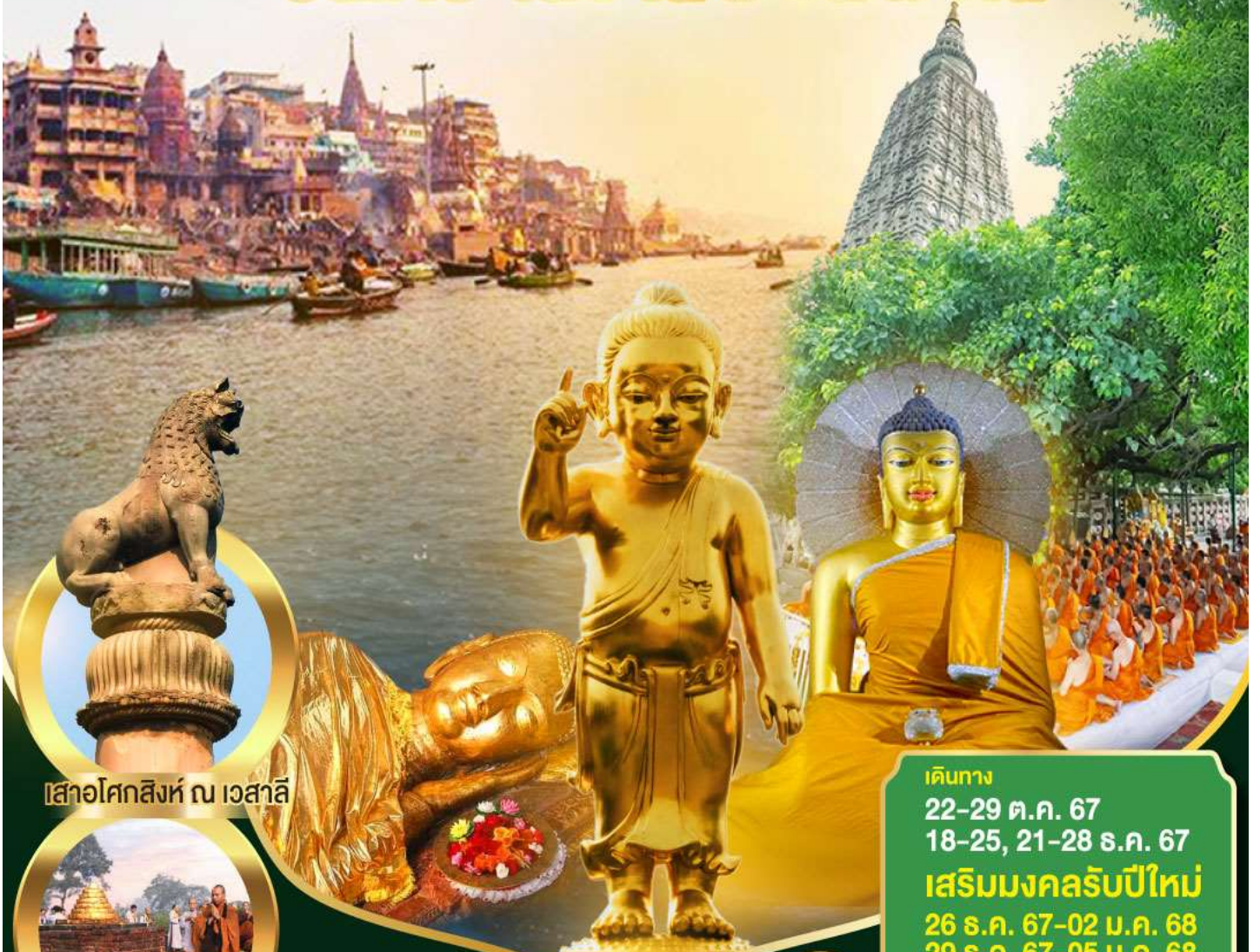
เสาชิงช้า อนุสาวรีย์