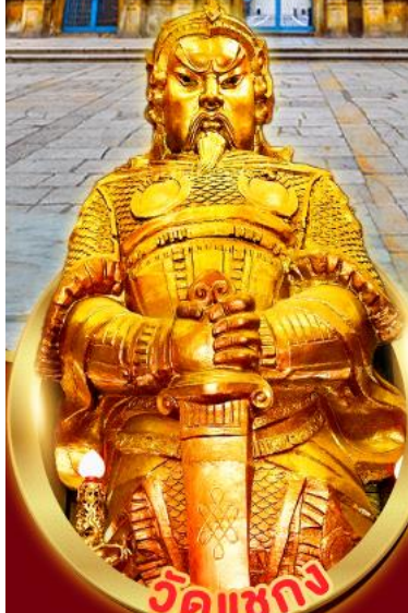
วัดแซกซง