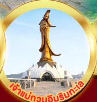
เจ้าแม่กวนอิมรินทระไล