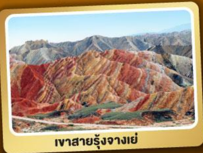
เวาสายรุ้งจางเย่