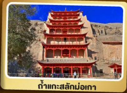
ถ้ำแกะสลักม่อเกา