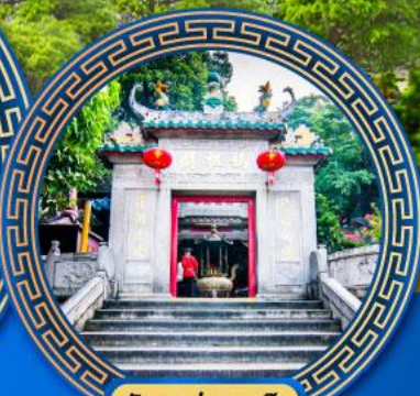
วัดอามา มาเก๊า