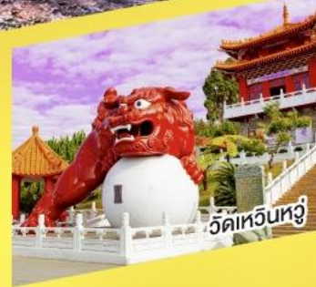
วัดหัวหน่วง