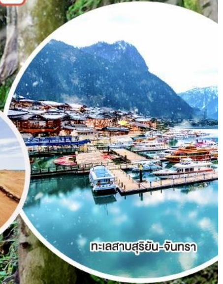
ทะเลสาบสุริยัน-จันทรา