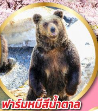
ฟาร์มหมีสีน้ำตาล