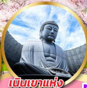
เนินเขาแห่ง พระพุทธรเจ้า