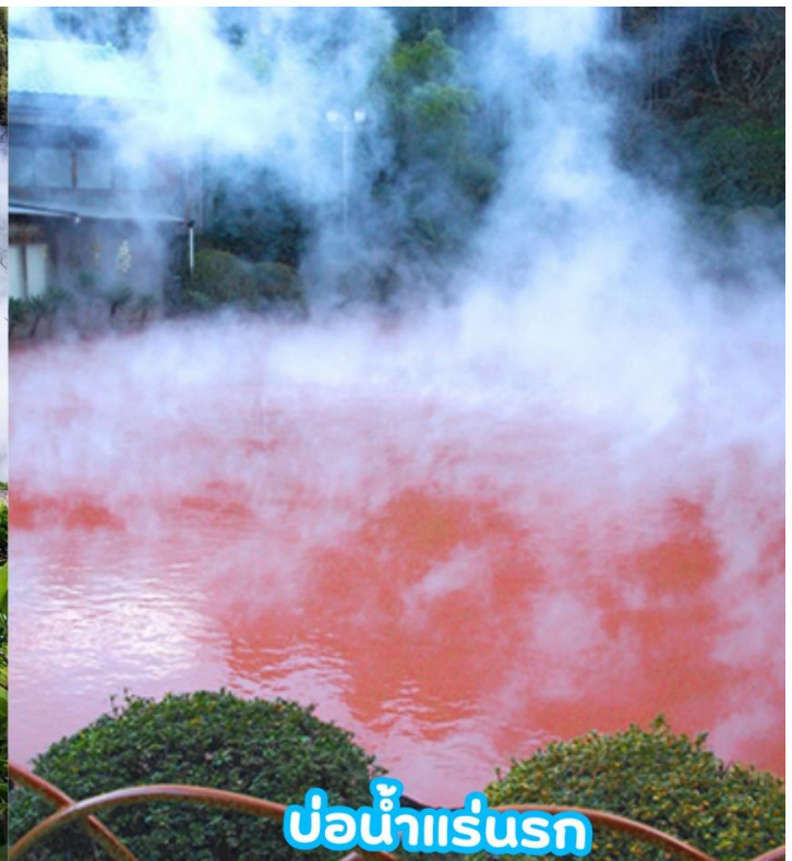
บ่อน้ำแร่รอก