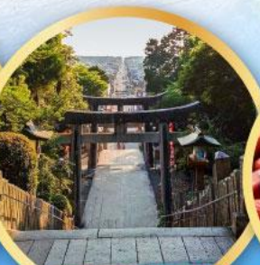
ศาลเจ้ามียาจิดากะ