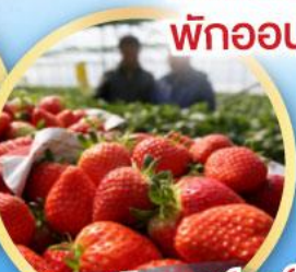
กิจกรรมเก็บสตอว์เบอร์รี่