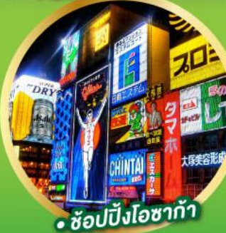
• ช้อปปิ้งโอซาก้า

เส้นทางสายอัลไพน์ทาเคยาม่า (Japan Alps Snow wall)