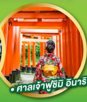
• ศาลเจ้าฟูชิมิ อินาริ