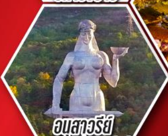
อบสาวรีย์