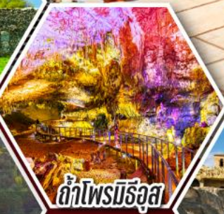
ด้าไฟรมิรัฐ