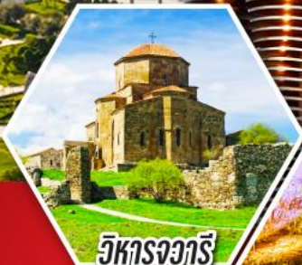
วิหารจวารี