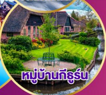
หมู่บ้านทึร์น