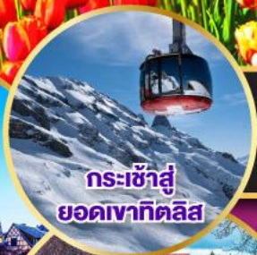
กระเช้าสู่ยอดเขากิตลิส