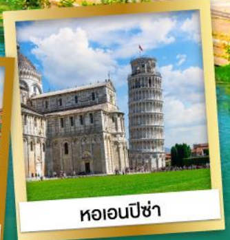
หอเอนปิซ่า