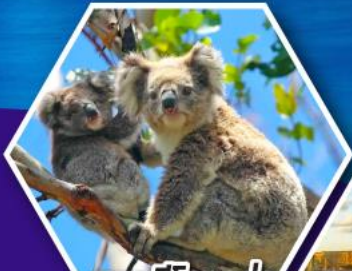
ชมหมีโคอาล่า ณ สวนสัตว์ซิดนีย์