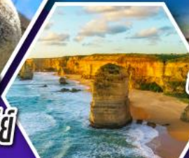
อุทยานบลูเมาส์แท่น