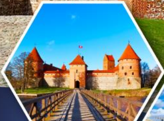
ปราสาททรไก