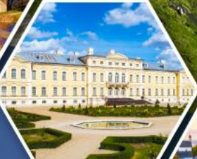
พระราชวังรินดาเล