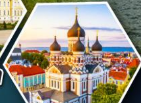
วิหารอเล็กซานเดอร์เนฟสกี (ทาลลินน์)

• ล่องเรือซิลเลียไลน์ข้าม จากเอสโทเนียสู่ฟินแลนด์ • เข้าชมโบสถ์หิน Rock Church