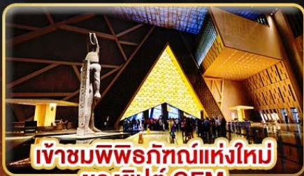
เข้าชมพิพิธภัณฑ์แห่งใหม่ ของอียิปต์ GEM

ชม 1 ใน 7 สิ่งมหัศจรรย์ของโลก “มหาพีระมิดแห่งกิซ่า”