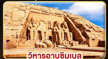
วิหารอาบูซิมเบล

น้ำหนักกระเป๋า 23Kg. (บินระหว่างประเทศ และบินภายใน)