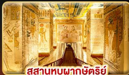
สุสานหุบผากษัตริย์