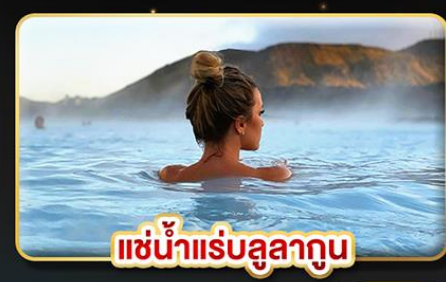
แช่น้ำแร่สุขภาพ