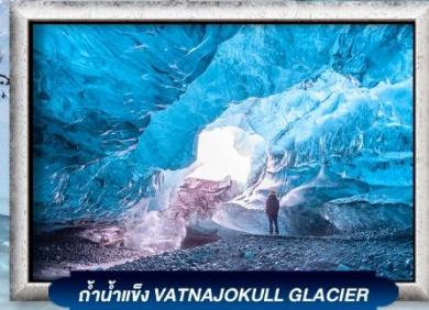
ถ้ำน้ำแข็ง VATNAJOKULL GLACIER

บินทรู สายการบิน Full Service | พิเศษ! ทานอาหารโดมกระจกิว 360 องศา