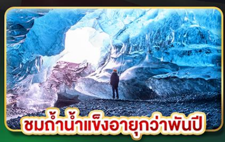
ชมถ้ำน้ำแข็งอายุกว่าพันปี

📅 เดินทาง : 15-24 มี.ค. 68 / 10-19 เม.ย. 68