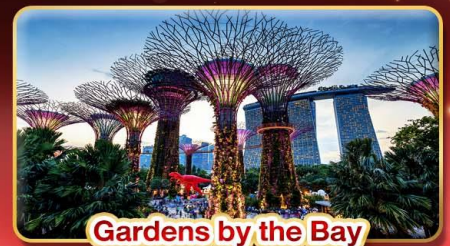
Gardens by the Bay