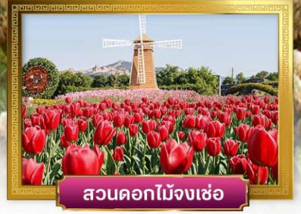
สวนดอกไม้จิ้งเซ่อ