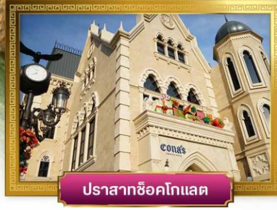
ปราสาทช็อคโกแลต