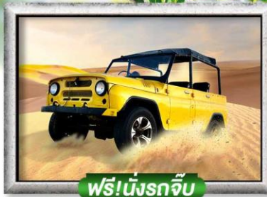
ฟรี!นั่งรถจี๊ป