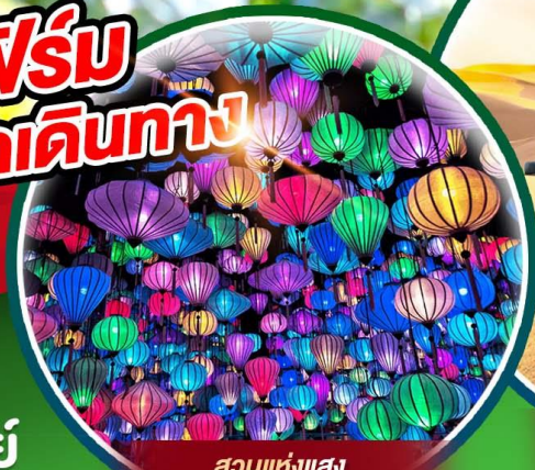
สวนแห่งแสง (Lumiere Light Garden)