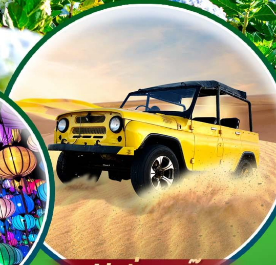
ฟรี! นั่งรถจี๊ป

พักดี 4 ดาว ที่เมืองดาลัด น้ำตกดาตันลา ทุ่งไฮเดรนเยีย นั่ง cable car ชมวัดตักลิ้ม ลำธารนางฟ้า โบสถ์นอร์ทเธอดาม