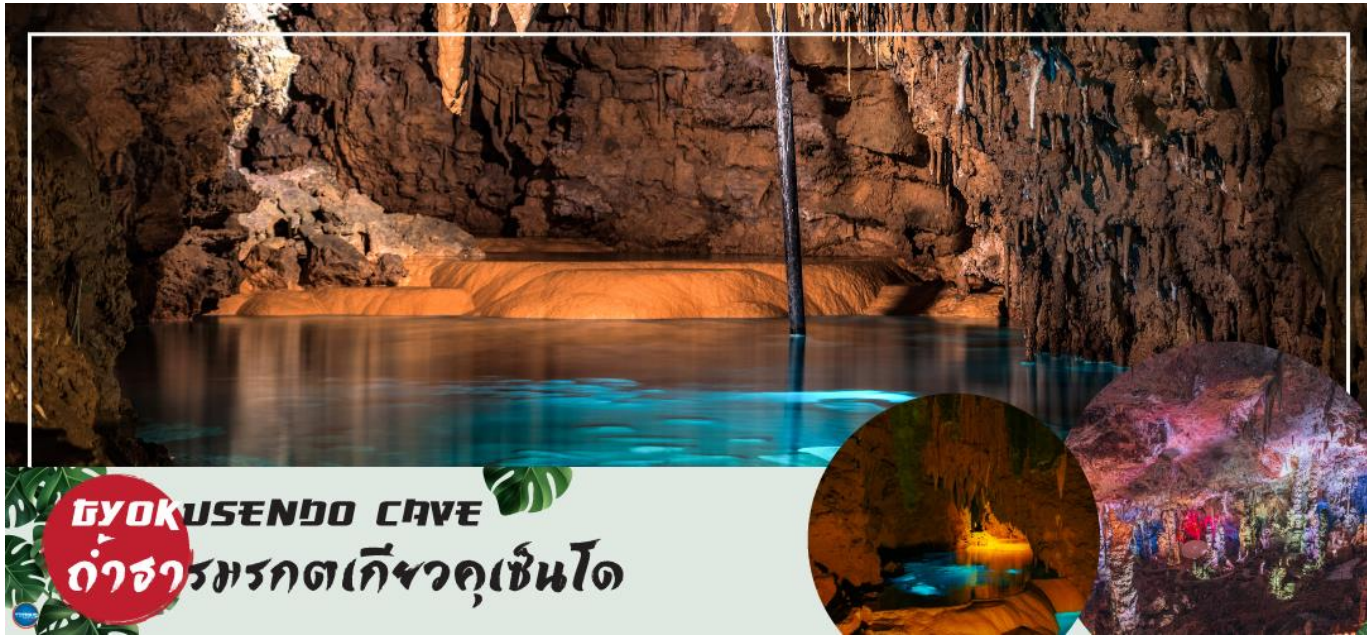
GYOKUSENDO CAVE ถ้ำธารมรกตเก็ซวุดเซินโด

ธารน้ำใสสะอาดไหลผ่านซึ่งปลาสามารถดำรงชีวิตได้เป็นอย่างดี นอกจากนี้ยังมีร้านจำหน่ายสินค้าประจำท้องถิ่น หรือของที่ระลึกต่างๆ รวมถึงร้านอาหารอีกด้วย จากนั้นนำท่านชม โรงงานแก้ว (GLASS FACTORY) (ใช้เวลาเดินทางประมาณ 20 นาที) ซึ่งตั้งอยู่บริเวณแหลมทางตอนใต้ของเกาะโอกินาวาโรงงานแห่งนี้เป็นโรงงานผลิตเครื่องแก้วที่ใหญ่ที่สุดในจังหวัดโอกินาวา เครื่องแก้วทั้งหมดทำด้วยเทคนิคการขึ้นแก้วดั้งเดิม โดย