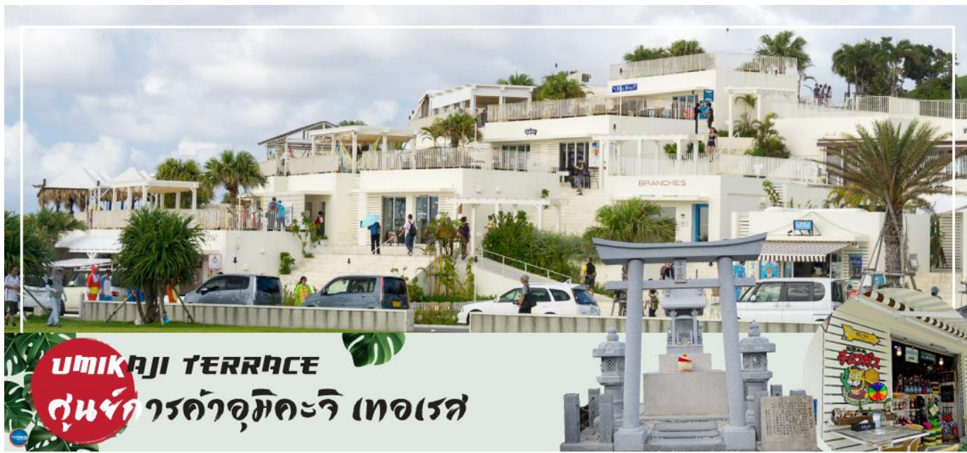
UMIKAJI TERRACE ศูนย์การค้าอุมิคะจิ เทอเรส

ไม่ได้ใช้แบบขึ้นรูป มีสีสันสดใส ด้วยฝีมือช่างผู้ชำนาญ ชมช่างทำแก้ว ในขณะที่ทำงานสร้างเครื่องแก้ว ที่เป็นการสร้างสรรค์ด้วยฝีมือของช่างแต่ละคน ชมห้องจัดแสดงผลงานเครื่องแก้ว และให้ท่านสามารถเลือกซื้อเครื่องแก้วที่ท่านถูกใจได้ จากนั้นนำท่านสู่ ศูนย์การค้าอุมิคะจิ เทอเรส (UMIKAJI TERRACE) (ใช้เวลาเดินทางประมาณ 25 นาที) ศูนย์การค้าแห่งใหม่ที่สร้างอยู่บนเนินเขาลาดเอียงบนเกาะเซนะกะจิมะ (Senagajima Island) ตั้งอยู่เลยจากรันเวย์สนามบินนาฮา (Naha Airport) เพียงไม่กี่ร้อย