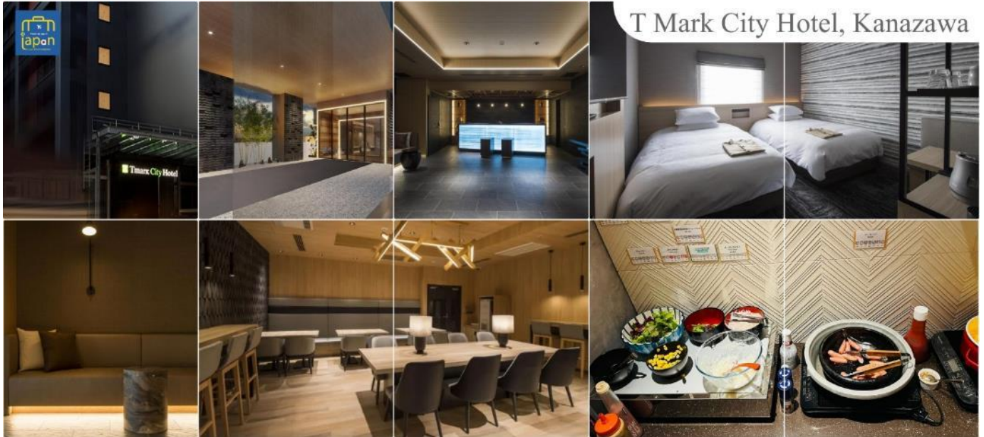
T Mark City Hotel, Kanazawa