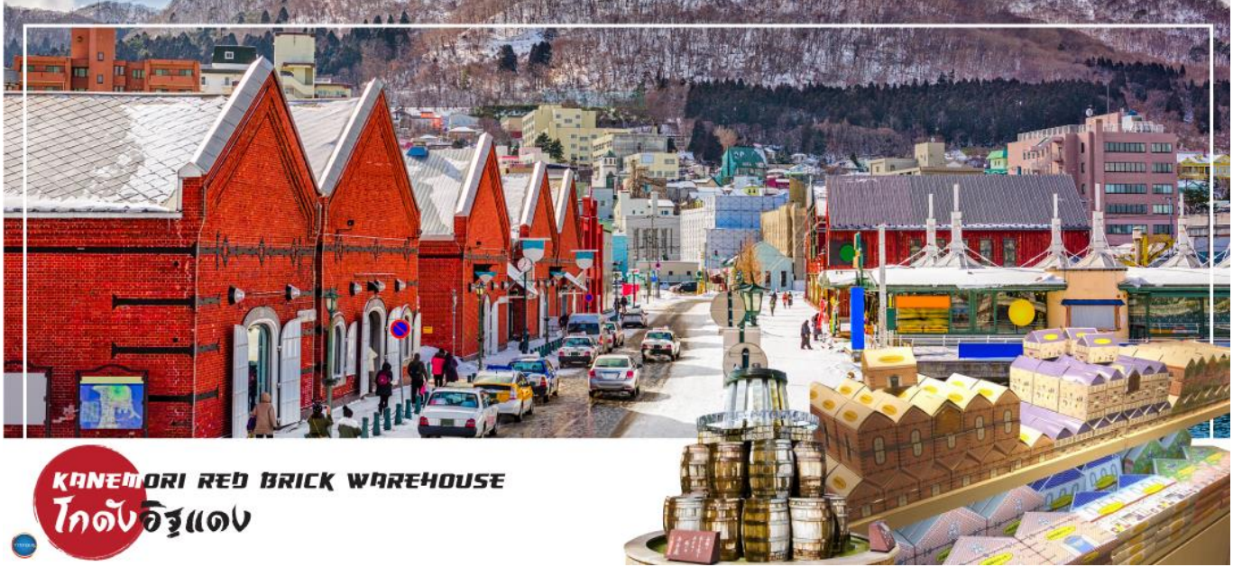
KANEMORI RED BRICK WAREHOUSE โกดังอิฐแดง

วันที่สาม เมืองฮาโกดาเตะ – ตลาดเช้าฮาโกดาเตะ – โกดังอิฐแดง – ย่านเมืองเก่าโมโตมาชิ – ป้อมโกเรียวกาคู (เช้าชม) – ทะเลสาบโทยะ – ออนเซน