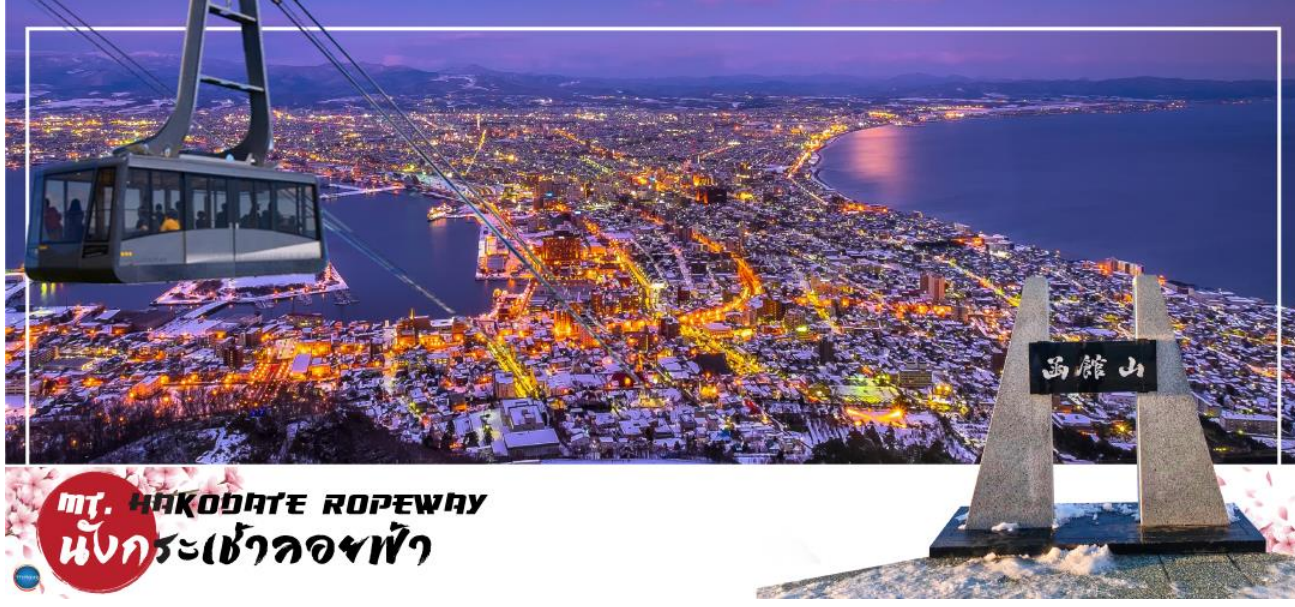
มท. HAKODATE ROPEWAY นั่งกระเช้ามองฟ้า

นำท่านนั่ง กระเช้าชมวิวกวางคืน ณ ภูเขาฮาโกดาเตะ (Mount Hakodate) สูง 334 เมตร ตั้งอยู่ในป่าทางตอนใต้ของปลายคาบสมุทรไคโงะกลางเมืองฮาโกดาเตะ ในวันที่ท้องฟ้าโปร่งทั้งกลางวันและกลางคืน สามารถมองเห็นวิวทิวทัศน์ทั้งงดงาม ซึ่งเป็นวิวทิวทัศน์ทั้งงดงาม ติดอันดับ1ใน3 ของญี่ปุ่น