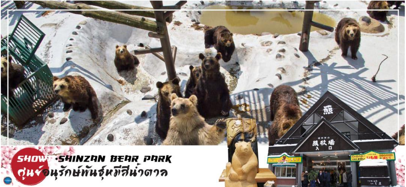
SHOWA SHINZAN BEAR PARK ศูนย์อนุรักษ์พันธุ์หมีสีน้ำตาล

วันที่สี่ ทะเลสาบโทยะ – ภูเขาไฟโชวะ (นั่งกระเช้า) – ศูนย์อนุรักษ์พันธุ์หมีสีน้ำตาล – สวนฟูกิดาชิ – เมืองซัปโปโร – ย่านซูซุกิโนะ