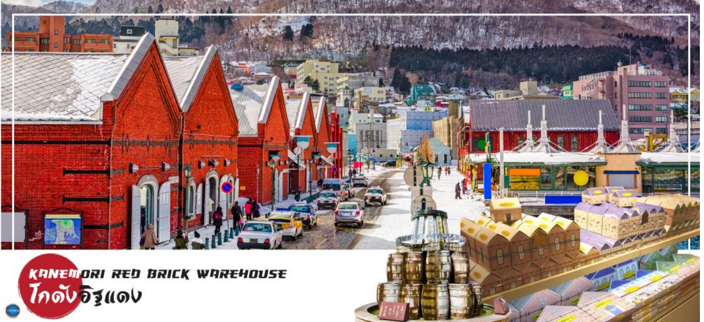
KANEMORI RED BRICK WAREHOUSE โกดังอิฐแดง

วันที่สาม เมืองฮาโกดาเตะ – ตลาดเช้าฮาโกดาเตะ – โกดังอิฐแดง – ย่านเมืองเก่าโมโตมาชิ – ป้อมโกเรียวคาคุ (เช้าชม) – ทะเลสาบโทยะ – ออนเซน