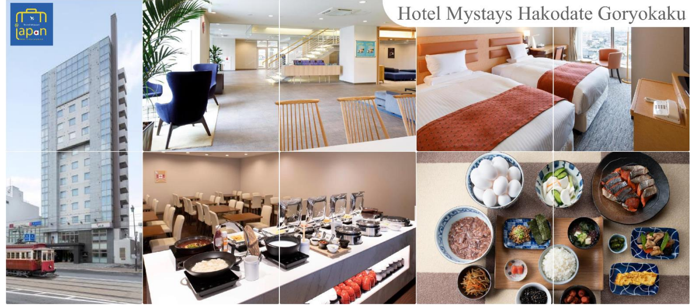
Hotel Mystays Hakodate Goryokaku

ที่พัก HOTEL MYSTAYS HAKODATE GORYOKAKU, HAKODATE หรือเทียบเท่าระดับเดียวกัน