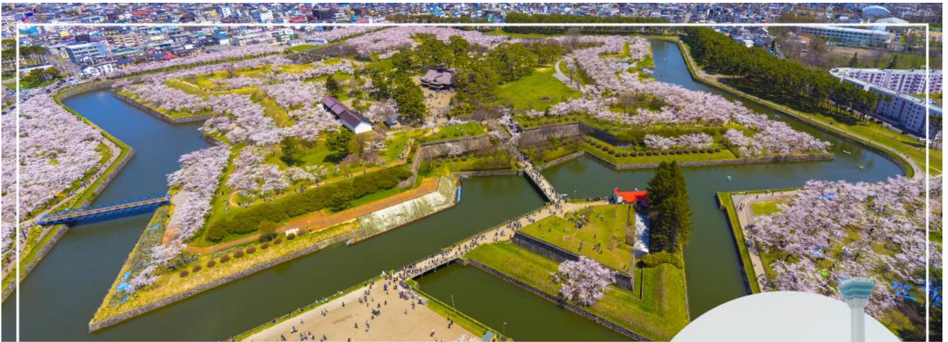
FORT GORYOKAKU ป้อมโกเรียวากุ

จากนั้นนำท่านสู่ ทะเลสาบโทยะ (Toya Lake) (ใช้เวลาเดินทางประมาณ 2.30 ชั่วโมง) เมืองที่โอบล้อมไปด้วยความสวยงามของธรรมชาติ ล้อมรอบไปด้วยภูเขาไฟ ทะเลสาบ ที่มีทัศนียภาพสวยงามน่าจดจำ ถ้าหากมาเที่ยวในจังหวัดฮอกไกโด