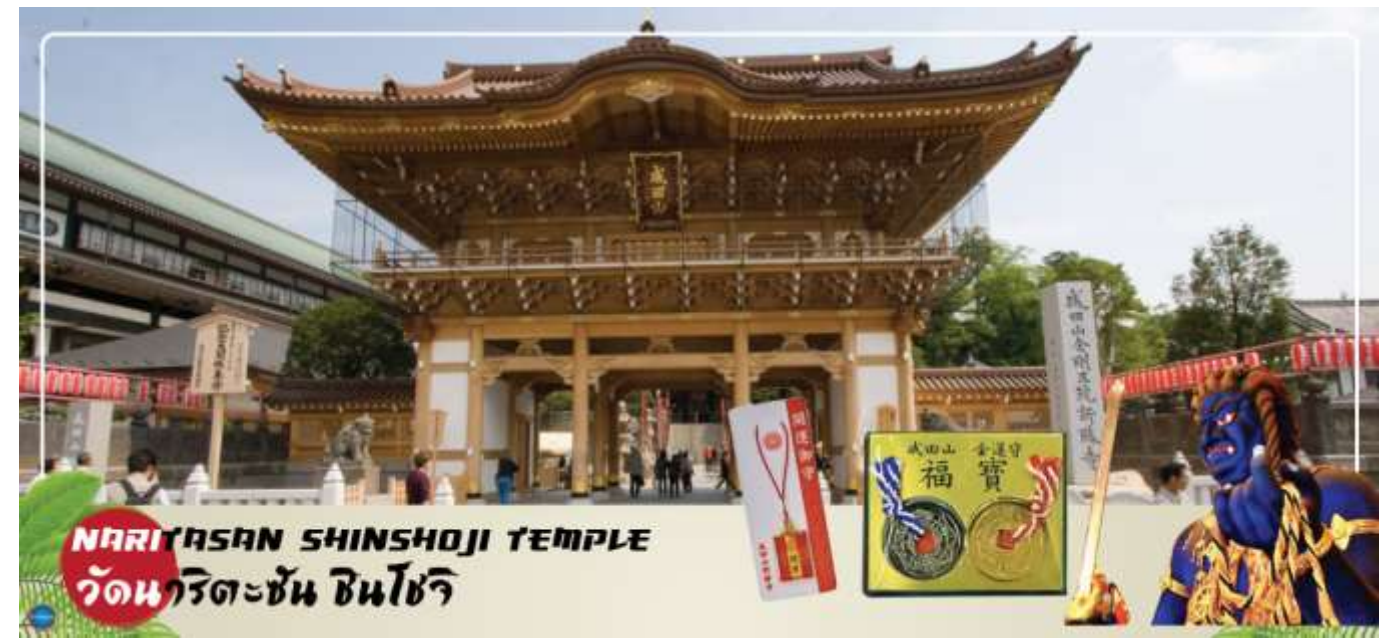
NARITASAN SHINSHOJI TEMPLE วัดนาริตะชั้น ซินโซจิ