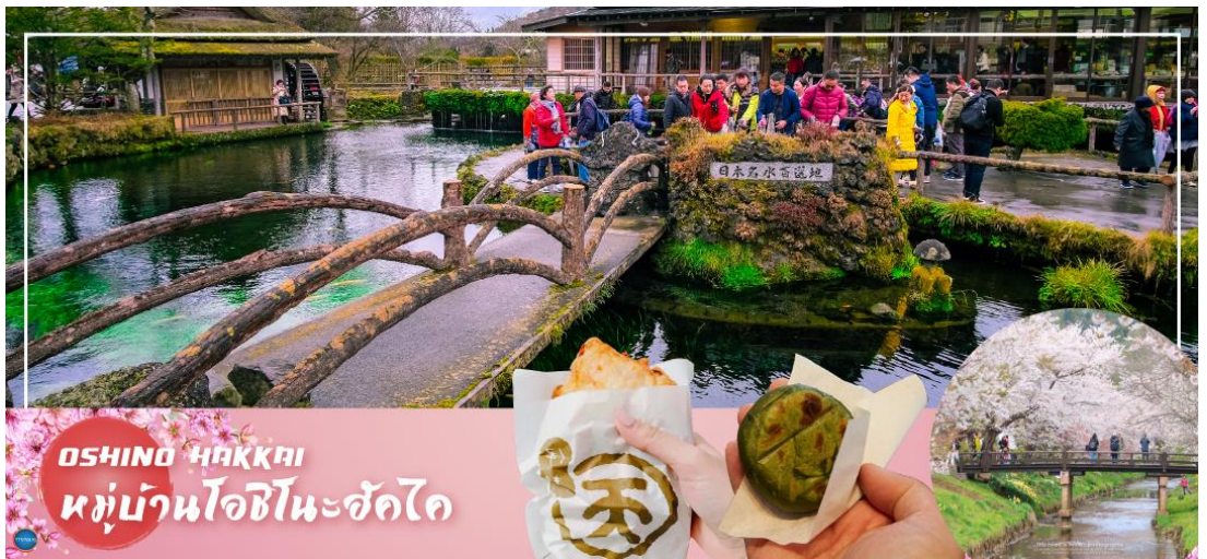
OSHINO HAKKAI หมู่บ้านโอชิโนะซึกไก

นำท่านชม หมู่บ้านโอชิโนะซึกไก (Oshino Hakkai) (จุดชมซากุระขึ้นกับภูมิอากาศ) เป็นในช่วงฤดูใบไม้เปลี่ยนสีเป็นจุดท่องเที่ยวสำคัญอีกสถานที่หนึ่ง โดยมีวิวภูเขาไฟฟูจิสีขาวตัดกับพื้นหลังสีฟ้าและใบไม้เปลี่ยนสี สีเหลือง แดง ส้ม เป็นภาพที่สวยงามมาก โอชิโนะซึกไกเป็นหมู่บ้านเล็กๆ ประกอบด้วยบ่อน้ำ 8 บ่อในโอชิโนะ ตั้งอยู่ระหว่างทะเลสาบคาวากูจิโกะ กับทะเลสาบยามานาคาโกะ บ่อน้ำทั้ง 8 นี้เป็นน้ำจากหิมะที่ละลายในช่วงฤดูร้อน ที่ไหลมาจากทางลาดใกล้ภูเขาไฟฟูจิผ่านหินลาวาที่มีรูพรุนอายุกว่า 80 ปี ทำให้น้ำใสสะอาดเป็นพิเศษ นอกจากนี้ยังมีร้านอาหาร ร้านจำหน่ายของที่ระลึก และขนมอบๆ ที่ขายทั้งผัก ขนมหวาน ผักดอง งานฝีมือ และผลิตภัณฑ์ท้องถิ่นอื่นๆ อิสระให้ท่านได้เพลิดเพลินกับการถ่ายรูปและซื้อของที่ระลึกตามอัธยาศัย