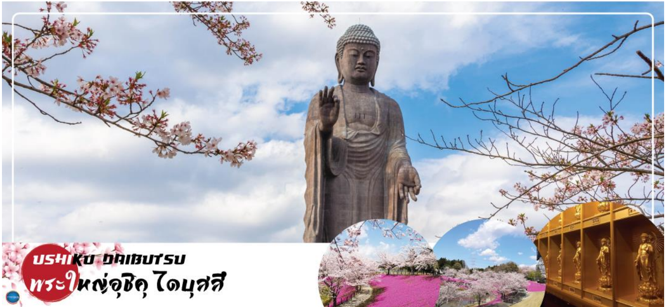
USHIKU ภูเขาอุซึกุ พระใหญ่อุซึกุ ไดบุตสึ

เมืองนาริตะ – เมืองอิบารากิ – พระใหญ่อุซึกุ ไดบุตสึ – ตลาดปลาโออาไร – ศาลเจ้าโออาไรอิโซซากิ – เสวโทริแห่งคามิอิโซะ – เมืองนาริตะ – อีออน มอลล์ – ท่าอากาศยานนานาชาตินาริตะ