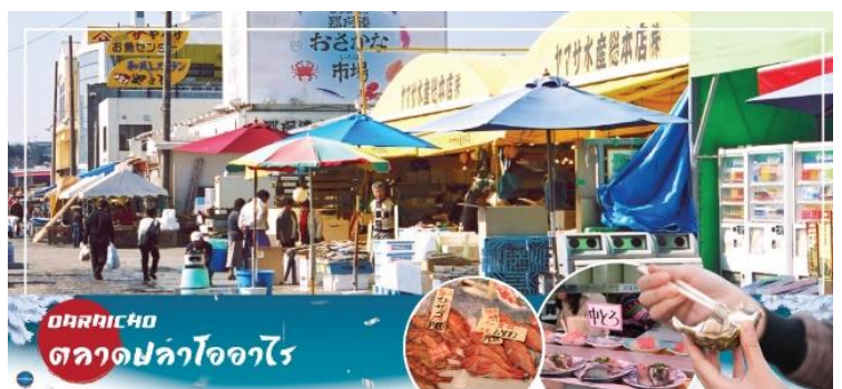
Oraicho ตลาดปลาโออาไร

อิมมอร์รอยกับอาหารทะเลสดใหม่ส่งตรงมาจากท่าเรือประมงโออาไร อาทิ ข้าวหน้าปลาดิบ หรืออาหารทะเลปิ้งย่าง นอกจากนี้ยังมีอาหารทะเลตากแห้งที่ทำเองโดยชาวประมง ซึ่งเหมาะสำหรับเป็นของฝากอีกด้วย อิสระรับประทานอาหารทะเลสดๆ แบบปิ้งย่าง เพลิดเพลินกับหลากหลายเมนูปลาสดๆ เช่น ปลาอังโค ปลาชิราสึ (ปลาข้าวสาร) ตามแต่ฤดูกาล หอยเชลล์ หอยดัลส์ หอยนางรมหมึกย่างเนย และกุ้ง เป็นต้น