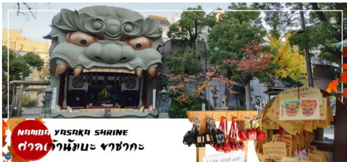
NAMBA YASAKA SHRINE ศาลเจ้านัมมะยาซากะ

นำทุกท่านเช็คอินจุดถ่ายรูปที่ ศาลเจ้านัมมะยาซากะ (Namba Yasaka Shrine) ตั้งอยู่ในย่านนัมมะของเมืองโอซาก้า ไฮไลท์ของศาลเจ้าแห่งนี้ คือรูปปั้นหน้าสิงโตอัปปากขนาดใหญ่ ที่เชื่อกันว่า สามารถกลืนกินปีศาจร้ายหรือสิ่งไม่ดีทั้งหลายให้หายไป และนำพามา