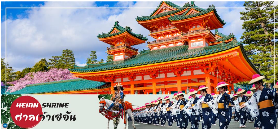
HEIAN SHRINE ศาลเจ้าเฮอัน

เมืองนาโกย่า – เมืองเกียวโต – ศาลเจ้าเฮอัน – การเรียนพิธีชงชาญี่ปุ่น – เมืองโอซาก้า – ศาลเจ้านัมมะยาซากะ – ช้อปปิ้งชินไซบาชิ