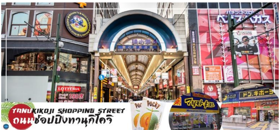
TANUKIKOJI SHOPPING STREET ถนนช้อปปิ้งทานุกิโคจิ

SMILE HOTEL PREMIUM - SAPPORO SUSUKINO หรือเทียบเท่าระดับเดียวกัน