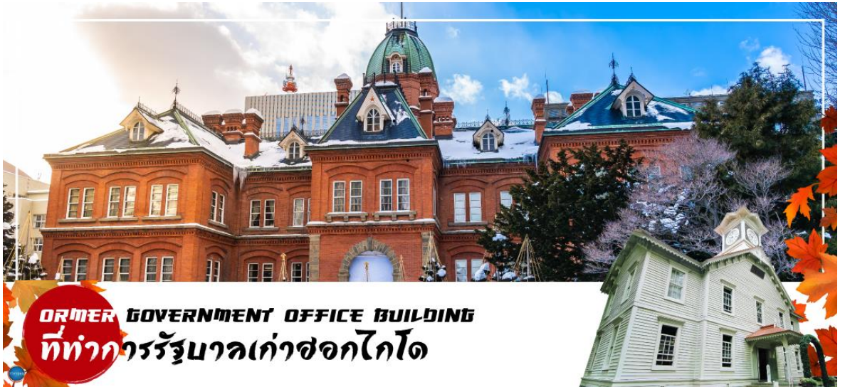
FORMER GOVERNMENT OFFICE BUILDING ที่ทำการรัฐบาลเก่าฮอกไกโด

จากนั้นผ่านชม หอนาฬิกาเมืองซัปโปโร (Sapporo Clock Tower หรือภาษาญี่ปุ่นเรียกว่า Sapporo Tokeidai) เป็นหอนาฬิกาโบราณมีลักษณะเป็นอาคารไม้ที่มีหลังคาสีแดงและผนังสีขาว ถูกออกแบบและบริจาคให้โดยรัฐบาลสหรัฐอเมริกา ในปี ค.ศ. 1878 เป็นสัญลักษณ์ทางวัฒนธรรมและประวัติศาสตร์ของเมืองซัปโปโร สำหรับตัวนาฬิกาถูกติดตั้งในปี ค.ศ. 1881 จากบริษัท E. Howard & Co. เมือง Boston และในปี ค.ศ. 1970 หอนาฬิกาแห่งนี้ถูกกำหนดให้เป็นทรัพย์สินทางวัฒนธรรมที่สำคัญแห่งชาติ อีกด้วย