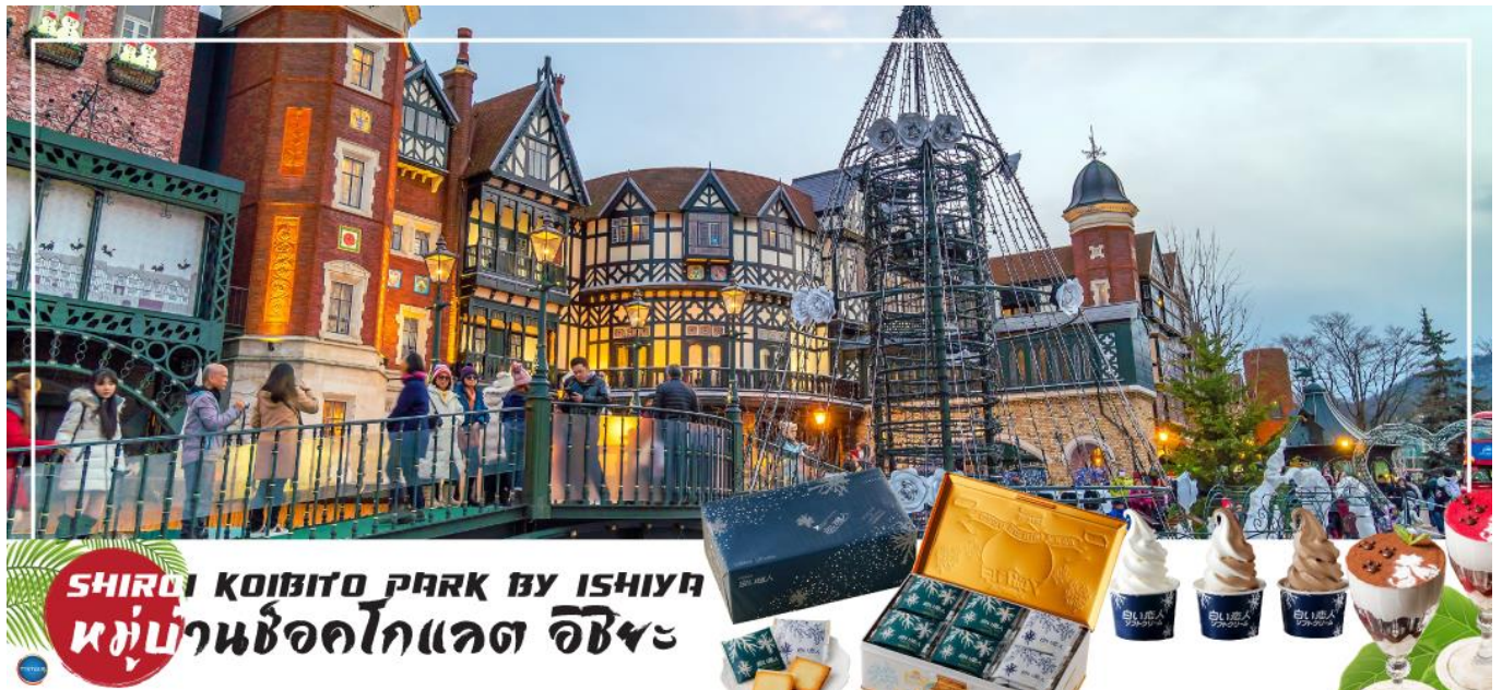
SHIROI KOIBITO PARK BY ISHIYA หมู่บ้านช็อคโกแลต อิชิยะ

นำท่านสู่ หมู่บ้านช็อคโกแลต อิชิยะ (Shiroi Koibito Park by Ishiya) ( ตำนานอก ) แหล่งผลิตช็อคโกแลตที่มีชื่อเสียงของญี่ปุ่น ตัวอาคารของ โรงงานถูกสร้างขึ้นในสไตล์ยุโรป แวดล้อมไปด้วยสวนดอกไม้ จึงทำให้บรรยากาศของหมู่บ้านช็อคโกแลตที่นี่ดูคลาสสิกและน่ารักไปอีกแบบ ช็อคโกแลตที่ขึ้นชื่อที่สุดของที่นี่คือ Shiroi Koibito ซึ่งมีความหมายว่าช็อคโกแลตชาวแต่คนรัก ท่าน