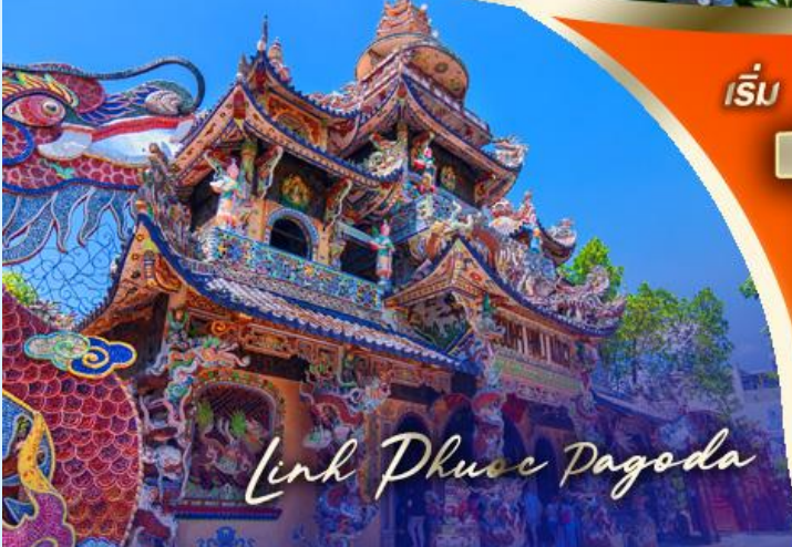
Linh Phuoc Pagoda