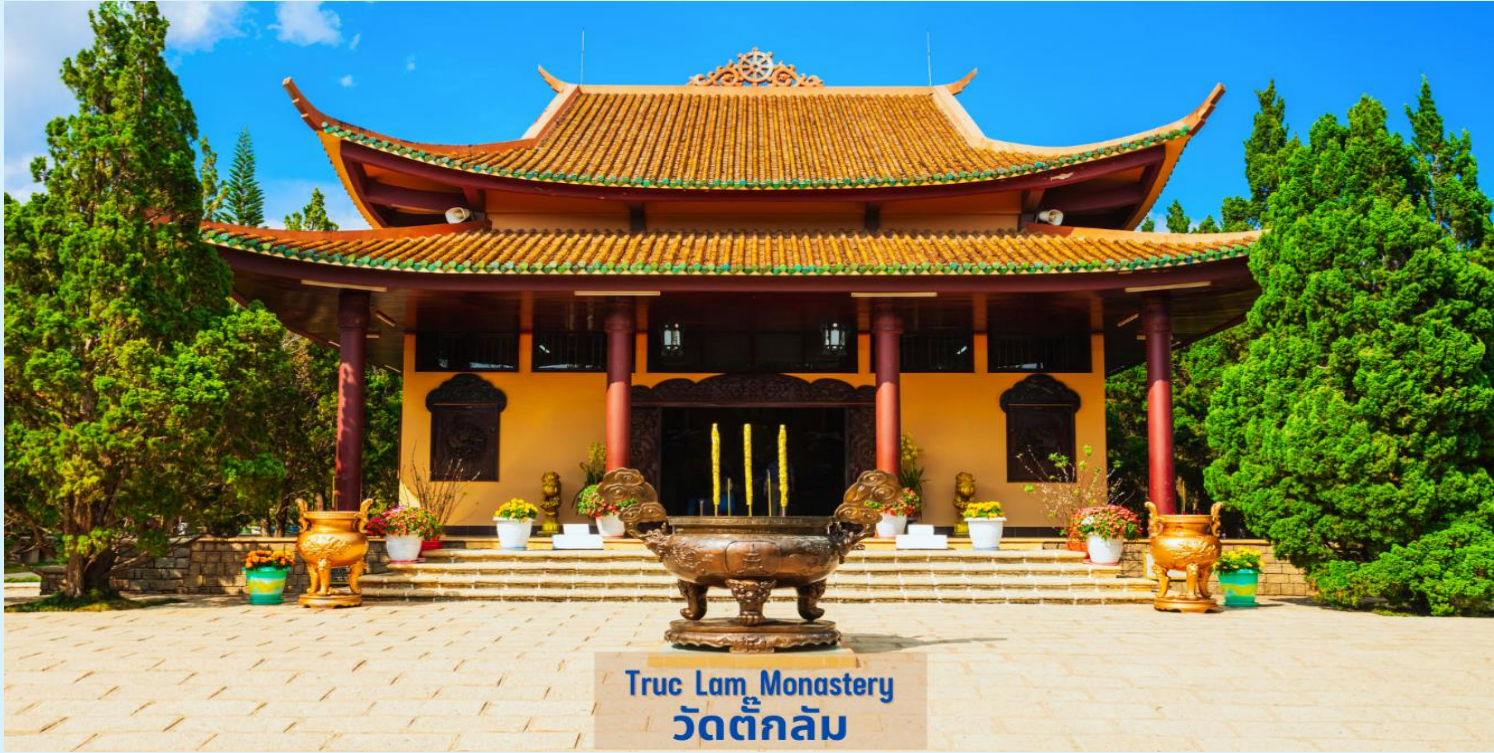
Truc Lam Monastery วัดตึกลับ

บริษัท แกรนด์ โฮลiday จำกัด 1/14 หมู่บ้าน แกรนด์ โฮลiday ซอยสุภาพงษ์ 1 แขวงหนองบอน เขตประเวศ กรุงเทพฯ 10250 ใบอนุญาต 11/11078 Tns. 081-969-9934