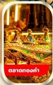
ตลาดทองคำ