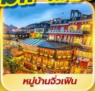
หมู่บ้านฉิวเฟิน