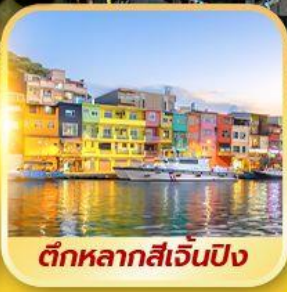
ตึกหลากสีเจินปิง