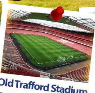
Old Trafford Stadium