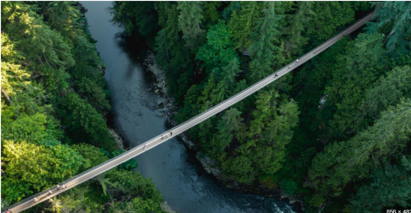
856 x 488

บริษัท แกรนด์ โฮลิเดย์ จำกัด 1/14 หมู่บ้าน แกรนด์ เดอ วิลลี่ ซอยสุภาพงษ์ 1 แขวงหนองบอน เขตประเวศ กรุงเทพฯ 10250 ใบอนุญาต 11/11078 Tns. 081-969-9934