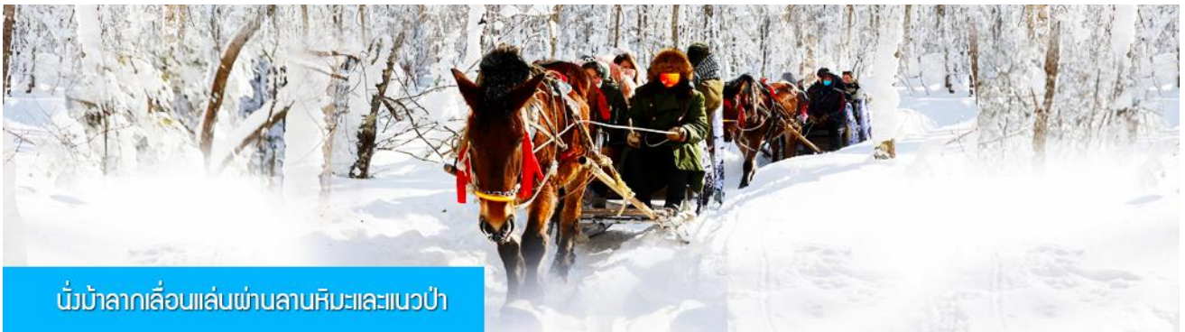
นั่งม้าลากเลื่อนเล่นผ่านลานหิมะและแนวป่า

รายการที่ 1 ระเบียบเดินชมวิว ภาพเขียนสิบลี้ 冰雪十里画廊 เป็นการเดินชมวิวธรรมชาติตามเนินเขา ท่ามกลางแนวป่าที่มีต้นไม้ที่มีน้ำแข็งเกาะอยู่ตามกิ่งไม้ เป็นภาพวิวธรรมชาติฤดูหนาวที่สวยงามน่าประทับใจและพบได้เฉพาะในฤดูหนาวทางภาคอีสานของจีนเท่านั้น เวลาที่ใช้สำหรับโปรแกรมเสริมนี้ประมาณ 1 ชั่วโมง อัตราค่าบริการ ท่านละ 220 หยวน หรือ 1100 บาท อัตรานี้รวมค่าบริการผ่านเข้าอุทยาน ค่ารถรับ ส่ง และค่าบริการของไกด์ท้องถิ่น และค่าบริการจัดการของบริษัททัวร์ท้องถิ่น.....หมายเหตุ โปรแกรมเสริมเป็นโปรแกรมที่ท่านต้องเสียค่าใช้จ่ายเองด้วยความสมัครใจ สำหรับท่านที่ไม่เข้าร่วมกิจกรรมดังกล่าวสามารถนั่งพักในรถได้