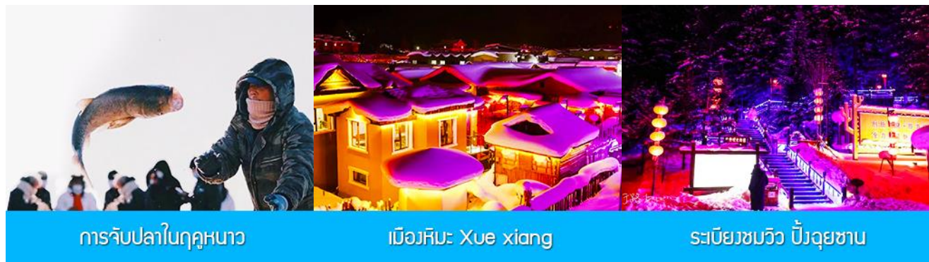
การจับปลาในฤดูหนาว

จำนวนมาก...พิเศษ ให้ท่านได้ชมการยกแหดักปลาจากสถานที่จริง และให้ท่านได้ชิมซูชิเนื้อปลาสด ๆ ที่ได้จากแหดักปลา