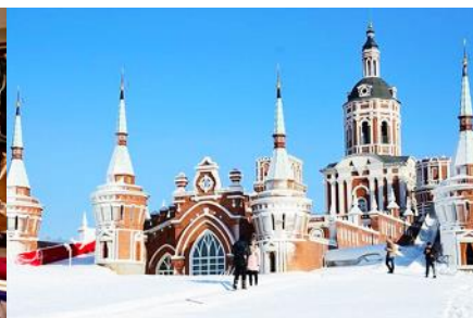
สวน LITTLE RUSSIA