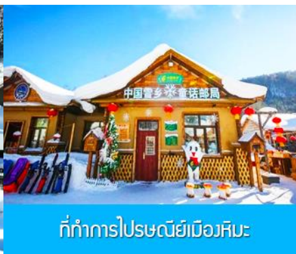
ที่ทำการไปรษณีย์เมืองหิมะ

วันที่สี่ พืชรักบี้เมืองหิมะ – ที่ทำการไปรษณีย์เมืองหิมะ - ไกด์ขายออฟชั่นภาพเขียนลิปส์-และออฟชั่น ม้าลากเลื่อน-เมืองฮาร์บิ้น