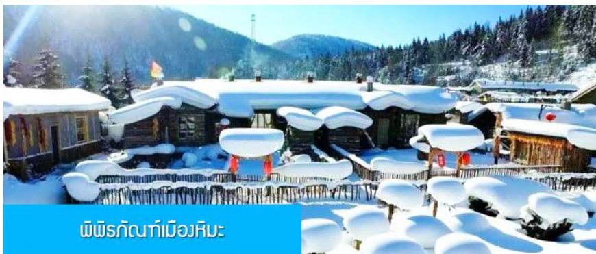
พืชรักบี้ที่เมืองหิมะ

การไปพักในเมืองหิมะทางทัวร์ไม่สามารถจัดรถทัวร์ไปส่งลูกค้าถึงหน้าโฮมสเตย์ได้ ทางคณะต้องนั่งรถเมล์หมู่บ้านเข้าไป โดยลูกค้าต้องถือหรือลากกระเป๋าเข้าที่พักด้วยตัวเอง เพราะโฮมสเตย์จะไม่มีพนักงานยกกระเป๋า มาคอยบริการยกกระเป๋าให้ผู้เข้าพัก ท่านควรจัดเตรียมกระเป๋าใบเล็กที่บรรจุเสื้อผ้า และเครื่องใช้จำเป็นสำหรับการพักผ่อน ณ โฮมสเตย์ในเมืองหิมะในคืนนี้ เพื่อสะดวกต่อการเคลื่อนย้ายกระเป๋า, และภายในห้องพักจะไม่มีผ้าเช็ดตัวผืนใหญ่ จะมีเพียงสบู่ แชมพูบริการทุกโรงแรม ท่านควรเตรียมแปรงสีฟันยาสีฟันติดไปด้วย