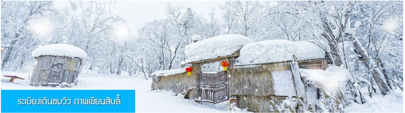
ระเบียบเดินชมวิว ภาพเขียนสิบลี้

รายการที่ 1 ระเบียบเดินชมวิว ภาพเขียนสิบลี้ 冰雪十里画廊 เป็นการเดินชมวิวธรรมชาติตามเนินเขา ท่ามกลางแนวป่าที่มีต้นไม้ที่มีน้ำแข็งเกาะอยู่ตามกิ่งไม้ เป็นภาพวิวธรรมชาติฤดูหนาวที่สวยงามน่าประทับใจและพบได้เฉพาะในฤดูหนาวทางภาคอีสานของจีนเท่านั้น เวลาที่ใช้สำหรับโปรแกรมเสริมนี้ประมาณ 1 ชั่วโมง อัตราค่าบริการ ท่านละ 220 หยวน หรือ 1100 บาท อัตรานี้รวมค่าบริการผ่านเข้าอุทยาน ค่ารถรับ ส่ง และค่าบริการของไกด์ท้องถิ่น และค่าบริการจัดการของบริษัททัวร์ท้องถิ่น.....หมายเหตุ โปรแกรมเสริมเป็นโปรแกรมที่ท่านต้องเสียค่าใช้จ่ายเองด้วยความสมัครใจ สำหรับท่านที่ไม่เข้าร่วมกิจกรรมดังกล่าวสามารถนั่งพักในรถได้