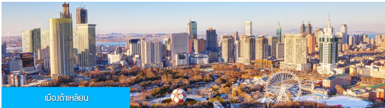
เมืองต้าเหลียน