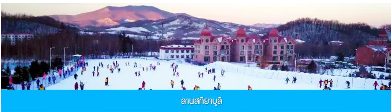
ลานสกียาบูลิ