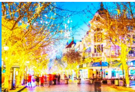
ถนนางยงลู่

วันที่ห้า เมืองฮาร์บิน – โบสถ์โซเฟีย - อนุสาวรีย์ป้องกันอุทกภัย-ถนนจงยางลู่ – นั่งรถไฟความเร็วสูงกลับเมืองต้าเหลียน – จัตุรัสซิงไห่ – ถนนรัสเซีย