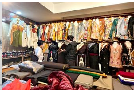
ศูนย์จำหน่ายอุปกรณ์กีฬาหนาว