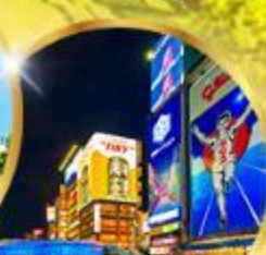
ช้อปปิ้ง ชินโซบาชิ