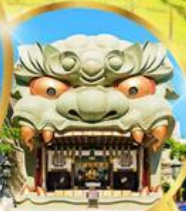
ศาลเจ้า นิมมะ ยาชากะ