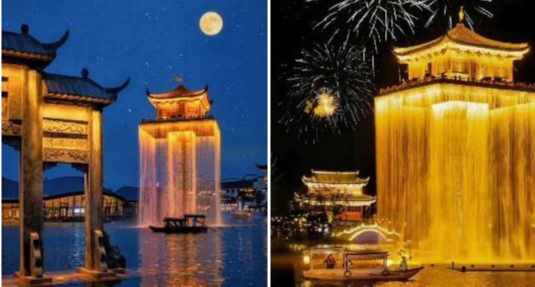
พักที่ WUNU ZHOU HOME GARDEN HOTEL หรือเทียบเท่าระดับ 4 ดาว

นำท่าน ชมแสงสียามค่ำคืนอันวิจิตร พร้อมล่องเรือชมแลนด์มาร์คแห่งใหม่ที่มีการแสดงแสงสีสุดอลังการ ถือเป็นแหล่งเช็คอินใหม่ที่ดึงดูดนักท่องเที่ยวได้มากที่สุดทีเดียว