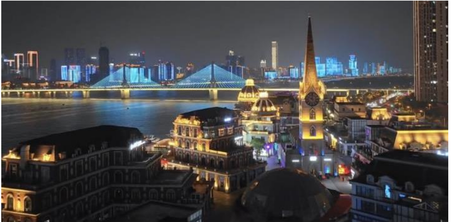
📍 พักที่ HOLIDAY INN DAWANGSHAN HOTEL หรือเทียบเท่าระดับ 4 ดาว

นำท่าน ชมวิวท่าเทียบเรือฉางชายามค่ำคืน ลงทุนโดยพ่อค้าชาวเจ้อเจียง ด้วยเงินลงทุน 800 ล้านดอลลาร์ โดยมีเป้าหมายเพื่อสร้างโมเดลใหม่ของธุรกิจ และแนะนำธุรกิจคลาสสิกของยุโรป แบบจำลองและสร้างตึกสไตล์ยุโรปขึ้นมา ไม่ว่าจะมาพักผ่อน หรือมารับประทานอาหาร ความบันเทิง ที่นี้ล้วนแต่มีหมด